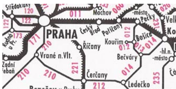
Výřez z mapy - červeně jsou vyznačena čísla traťových úseků